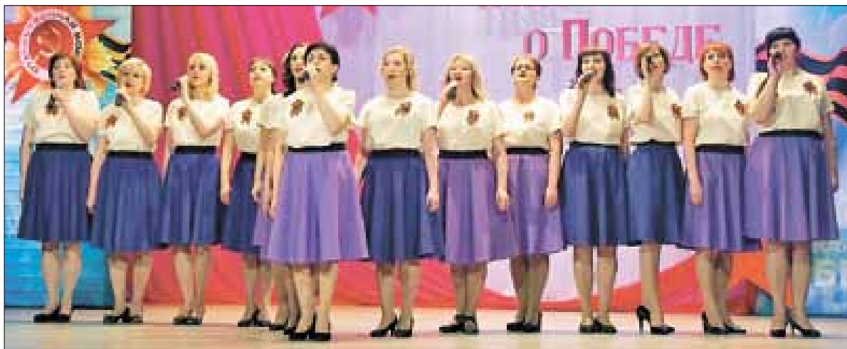
■ Среди трудовых коллективов производственной и социальной сферы победителем стала первичная профсоюзная организация Архангельского ЦБК.

ет впервые. Он порадовал зрителей и жюри изящным исполнением песни «Майский вальс».