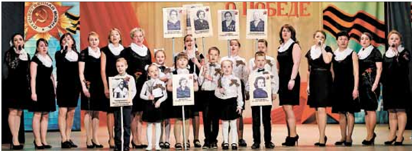
■ Архангельская городская больница № 6 заняла второе место в номинации «Трудовые коллективы».

Коллектив детского сада № 140 «Творчество» в фестивале участву-