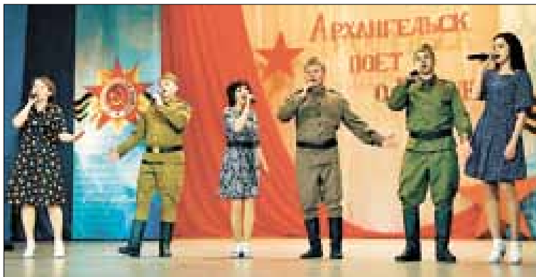
■ Гости из Северодвинска – детсад «Чебурашка» занял второе место среди дошкольных учреждений.