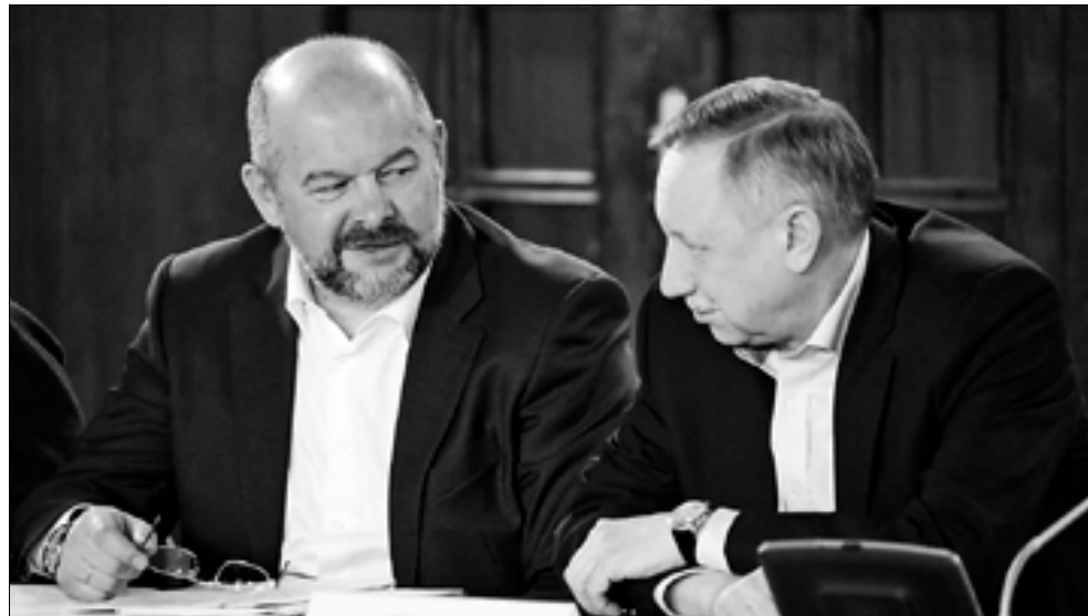
Губернатор Архангельской области Игорь Орлов и полномочный представитель Президента РФ в СЗФО Александр Беглов.

Это важно: Предложения Игоря Орлова по совершенствованию рыбопромышленной отрасли одобрены российским правительством