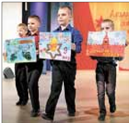
■ К подготовке номеров участники подходят творчески.