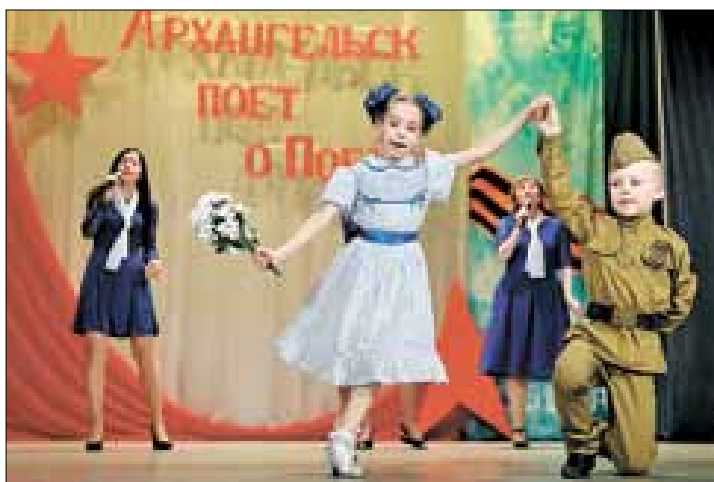
■ Первое место среди дошкольных учреждений – детский сад № 140 «Творчество».